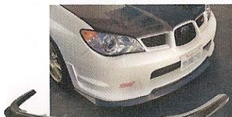
ノーマルボディのフロントバンパーに装着するカーボン製のリップスポイラー。さり気なくスポーツ性を高めたい場合に重宝する。本体価格、10万5000円。

■サウンドコネクション ☎ 046-263-5945 http://www.soundconnection.co.jp 神奈川県大和市深見496-5