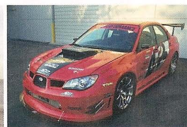
Subaru WRX (2006-2007) SS/GT Widebody Aerodynamic Kit