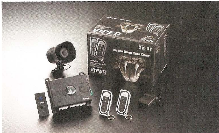
サウンドコネクションが提案するシステムは、バイパーの3000V（10万5000円）。2段階ショックセンサー、イモビ機能など充実のセキュリティ機能と装備を誇るシステムだ。さらに、そこにバックアップバッテリー（2万4990円）と傾斜センサー（1万5540円）を追加するのがオススメとか。