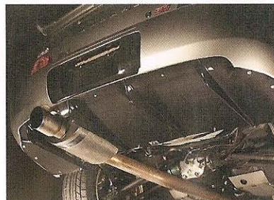
リアバンパー下側を大きく覆う形式のディフューザーを設定。APRが得意としているカーボンパーツで、スパルタンな姿形が特徴。本体価格、8万8200円。

■サウンドコネクション ☎ 046-263-5945 http://www.soundconnection.co.jp 神奈川県大和市深見496-5