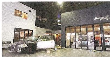
巨大な倉庫風の建物の中に作業に特化したブースが入っている店舗。ロケーションもよく駐車場も完備されているので、気軽に訪れてみよう。