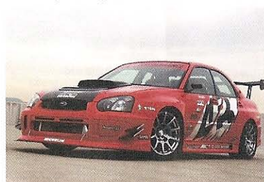
前後左右のフェンダーと前後バンパー、サイドスポイラーなどで構成されるキットだから後付け感のないスマートなスタイリングが特徴だ。ウイングとミラーは別売り。価格は工賃別で67万2000円。（GDB用）